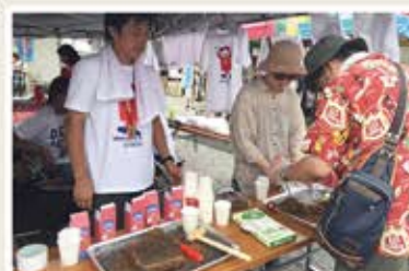
西表黒糖とポストくんBOXのコラボレーション